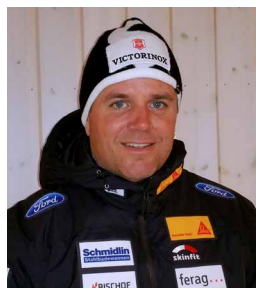
Beat Hefti Bobfahrer, Europameister Zweierbob 2016