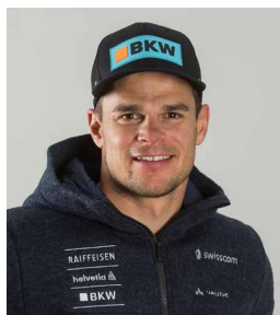
Patrick Küng Ski Alpin Nationalkader, Weltmeister Abfahrt 2015