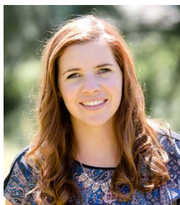
Tina Weirather Ski Alpin, Weltcup- Siegerin Super-G 16/17